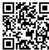
パソコン用 QR コード

※モバイル端末でアクセスする場合は、「Mejiro_Wi-Fi」に接続してアクセスください。