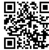
モバイル用 QR コード

パソコンへのログインと同様に、 学籍番号とパスワード入力し、ログインしてください