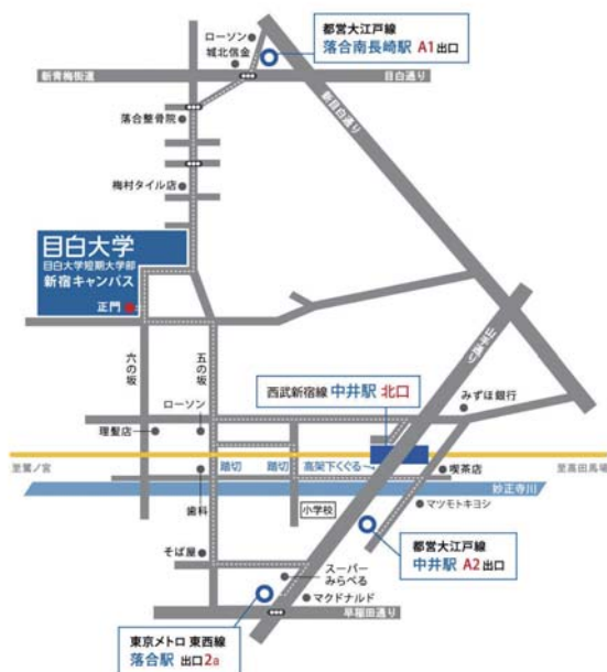
各最寄り駅から目白大学へのアクセスマップ