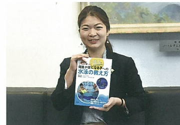
発達障害のある子への泳ぎ方の指導方法を写真で紹介した『発達障害のある子への水泳の教え方』(合同出版)を2019年7月出版。

水泳と福祉、両輪の学びと経験を生かして 水泳は5歳から始めました。学校の体育は苦手でしたが、水の世界が好きで高校まで続けました。心理学に興味があったので、幅広い領域を学べる目白大学の心理カウンセリング学科を選び、在学中に水泳指導員とホームヘルパー2級の資格を取得。スィミングスクールや介護施設などでアルバイトをしているうちに、地元の三鷹市で、障害のある子どもの水泳教室を知り、ボランティアで参加するようになりました。 障害があってもなくても、例えばクロールを泳ぐために必要な技術に違いはありませんが、障害により指導方法は変わります。片足が無い方と半身麻痺の方では、パラオの取り方が異なるからです。最初は、発達障害や知的障害の子どもたちには話が伝わっていないか、信頼関係を築けるか、戸惑いました。障害者心理学や行動療法の授業で、障害のある方には世界がどう見えるか、どんなサポートができるかを学び、多くの気づきを得ました。現場での疑問は大学に戻って先生に質問したり、図書館で資料を読んだり、それでもわからなければ再び先生に意見を求めたりして、私の中に蓄積された経験をノートに書きためていきました。 障害者も水泳を楽しめる環境を全国に 卒業後も障害者水泳に関わり、指導方法の研究と経験を重ねてきました。教室の数の少なさを、指導者間の障害者理解の差など、さまざまな課題も見えてきました。そこで2015年、障害者水泳クラブ「アクア