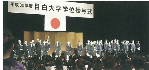
平成30年度 目白大学学位授与式