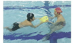
子どもの気持ちに寄り添った指導を大事にしている。

水泳と福祉、両輪の学びと経験を生かして 水泳は5歳から始めました。学校の体育は苦手でしたが、水の世界が好きで高校まで続けました。心理学に興味があったので、幅広い領域を学べる目白大学の心理カウンセリング学科を選び、在学中に水泳指導員とホームヘルパー2級の資格を取得。スィミングスクールや介護施設などでアルバイトをしているうちに、地元の三鷹市で、障害のある子どもの水泳教室を知り、ボランティアで参加するようになりました。 障害があってもなくても、例えばクロールを泳ぐために必要な技術に違いはありませんが、障害により指導方法は変わります。片足が無い方と半身麻痺の方では、パラオの取り方が異なるからです。最初は、発達障害や知的障害の子どもたちには話が伝わっていないか、信頼関係を築けるか、戸惑いました。障害者心理学や行動療法の授業で、障害のある方には世界がどう見えるか、どんなサポートができるかを学び、多くの気づきを得ました。現場での疑問は大学に戻って先生に質問したり、図書館で資料を読んだり、それでもわからなければ再び先生に意見を求めたりして、私の中に蓄積された経験をノートに書きためていきました。 障害者も水泳を楽しめる環境を全国に 卒業後も障害者水泳に関わり、指導方法の研究と経験を重ねてきました。教室の数の少なさを、指導者間の障害者理解の差など、さまざまな課題も見えてきました。そこで2015年、障害者水泳クラブ「アクア