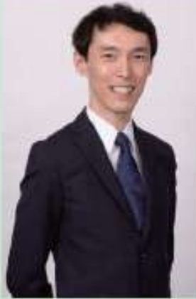
目白大学同窓会 「目白大学創立30周年に寄せて」 編集長 田中 了

1994年の開学以来、強まぬ発展を遂げてきた母校の歴史を振り返るこの一冊は、まさに30年の想いが詰まったタイムカプセルです。 本誌の制作にあたり、理事長、学長、副学長、そして各学部の学部長をはじめ、多くの教職員、関係者の皆様から、心温まるメッセージや、大学への熱いエピソードをお寄せいただきました。皆様が目白大学の設立と成長に捧げられた情熱と、未来への期待を、誌面を通して強く感じていただけるはず。 この記念誌が、卒業生、在学生、そして大学に関わる全ての皆様にとって、母校への愛着をさらに深め、次の飛躍への一歩を踏み出すための原動力となることを願っています。