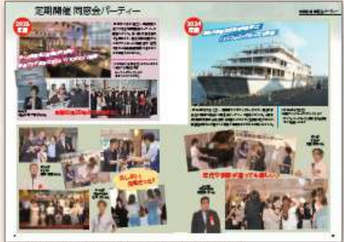
年代や学部が違っても「目白ファミリー」が集まると楽しい!