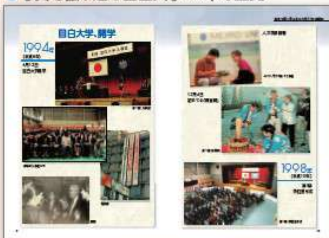
時代を感じる写真がいっぱい!