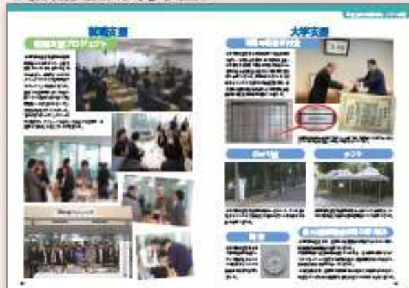
同窓会協力協賛事業・イベント実績をご紹介します。