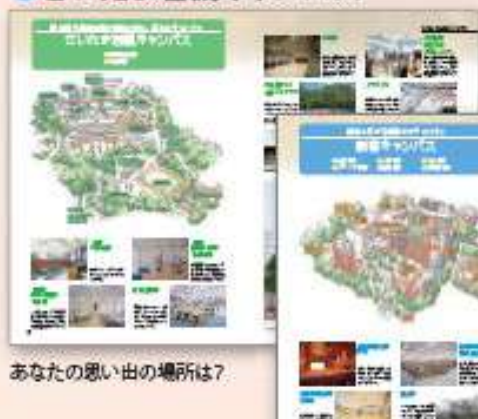
あなたの思い出の場所は?