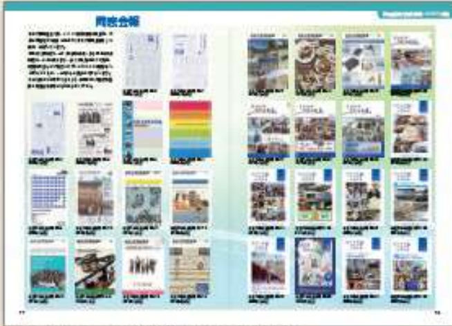
2001年3月発行のvol.0(創刊準備号)からの表紙を掲載。