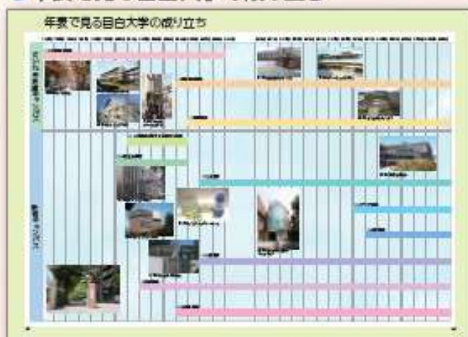
30年の間に学部が増えました。