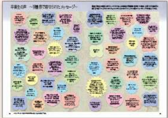
母校への想いや学生時代の思い出を語ってくださいました。